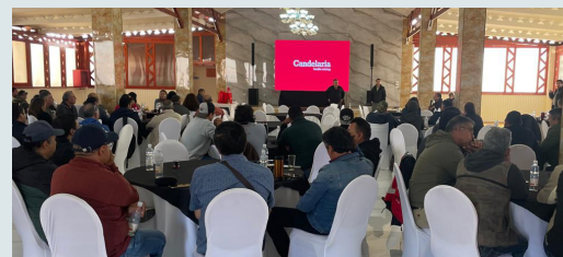
Grupo 2 Operaciones Mina