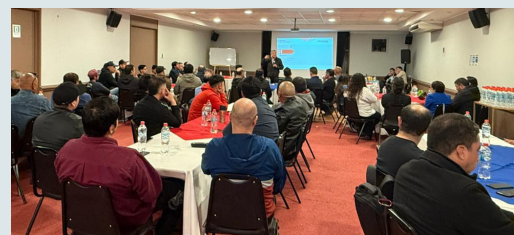
Dirección de Operaciones

Esta instancia virtual se complementa con las bajadas cara a cara que cada ejecutivo/a y direcciones vienen realizando desde el taller de 100 días. Estos cascadeos, son esenciales para fomentar una comunicación más efectiva y cercana dentro de nuestra Compañía. Además, crea un ambiente de trabajo más eficiente, inclusivo y colaborativo, promoviendo la claridad, la confianza y la motivación además de conocer información relevante para Candelaria de primera fuente.