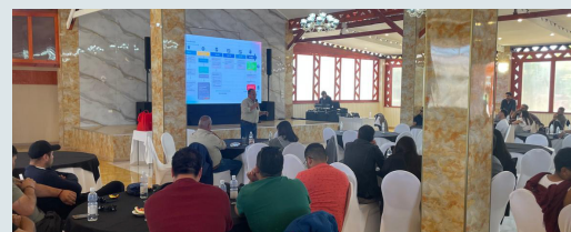
Grupo 4 Operaciones Mina