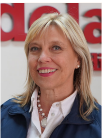
AURORA WILLIAMS MINISTRA DE MINERÍA

En Candelaria tenemos un 16% de mujeres y estamos trabajando para aumentar esa cifra, porque sabemos que su participación beneficia a la compañía, la región y a todas aquellas mujeres que desean integrarse a esta importante actividad económica.